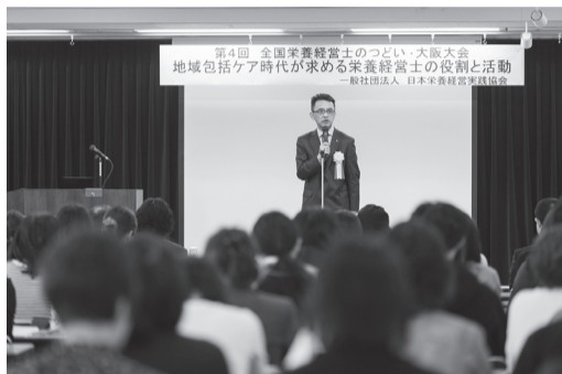
2019年に開催された第4回大阪大会では会場に多くの参加者が集まった

第8回となる「全国栄養経営士のつどい」を3月9日(日)に東京で開催することが決定した。今大会は会場開催がメインとなり、オンラインでは、後日アーカイブでの視聴を予定している。ぜひ、多くの栄養経営士が参加することを期待している。